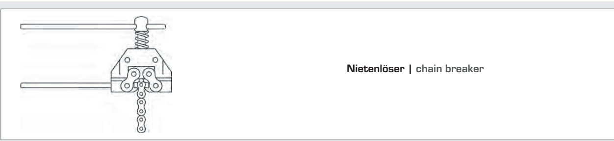
Nietenlöser | chain breaker

für Kettenteilungen [Zoll] for chain pitch [inch]